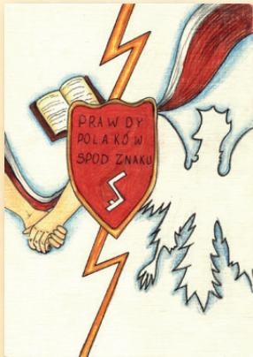
Oryna Kokhanevych – wyróżnienie