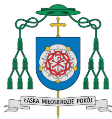
Ordynariusz Diecezji Bydgoskiej