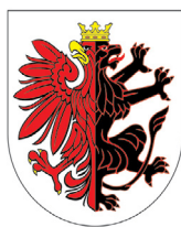
Marszałek Województwa Kujawsko-Pomorskiego