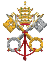
Wspólnoty Sanktuarium MBKM