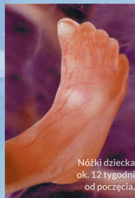
Nóżki dziecka ok. 12 tygodni od poczęcia.

Dziecko otwiera i zamyka usta, porusza gałkami ocznymi, ściga brwi, „ćwiczy” mimikę. Potrafi się poruszać nieprzerwanie przez 7,5 min, a odpoczywa najwyżej 5,5 min. Jego aktywność pobudzają śmiej, kichanie i kaszel mamy. Dziecko potrafi „tań- czyć” w brzuchu, choć mama jeszcze tego nie czuje.