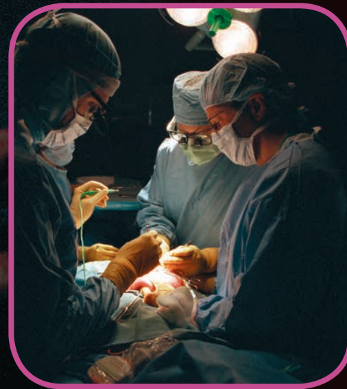
Fot. Michael Clancy x2