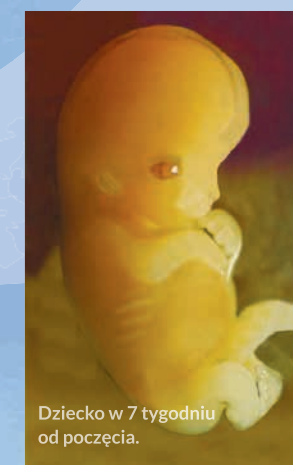
Dziecko w 7 tygodniu od poczęcia.

Wszystkie narządy wewnętrzne kończą dojrzewanie. Serce przetacza około 300 l krwi dziennie. Kontakt mamy z dzieckiem jest więzią osoby z osobą. Dziecko przeżywa emocje. Coraz mniej różni je od noworodka.