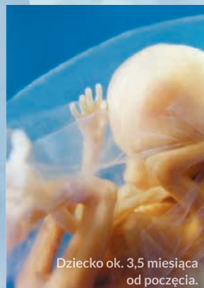
Dziecko ok. 3,5 miesiąca od poczęcia.

Serce dziecka przepom- puje 30 l krwi na dobę i można je usłyszeć przez stetoskop. Płód połyka 1 l płynu owodniowego, który dostarcza mu wodę i składniki odżyw- cze. Dzięki temu dziecko ćwiczy mięśnie potrzebn- e po narodzinach do jedzenia, oddychania i mówienia. Sylwetka mamy się zmienia.