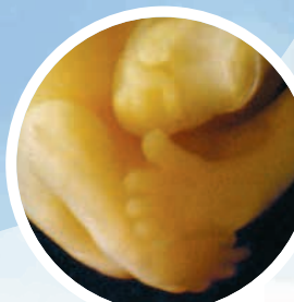
Nóżki dziecka w 7 tygodniu od poczęcia.

Długość ciała dziecka wynosi 2 cm. Serce uderza 130–160 razy na minutę. Gruczoły płciowe są już mocno zróżnicowane, więc można określić płeć, choć w ba- daniu USG jeszcze jej „nie widać”.