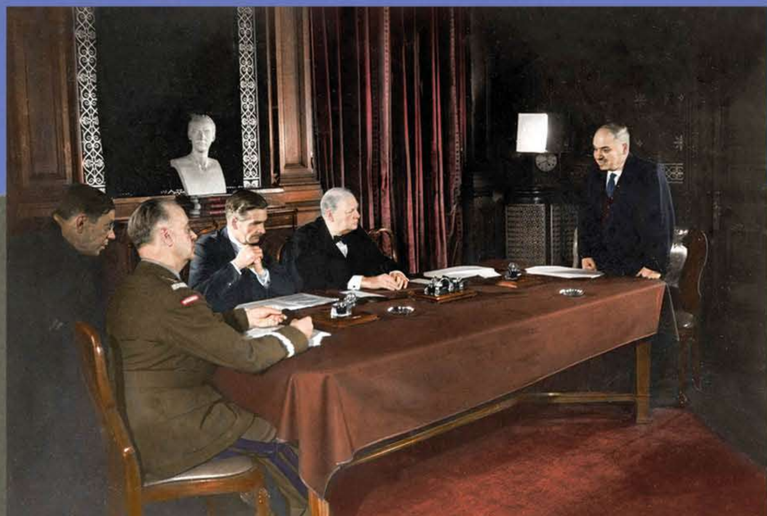
Podpisanie układu Sikorski-Majski, przywracającego stosunki dyplomatyczne między Polską a ZSRS. Londyn, 30 VII 1941 r.

The signing of the Sikorski-Majski Agreement reinstating diplomatic relations between Poland and the USSR. London, 30 July 1941