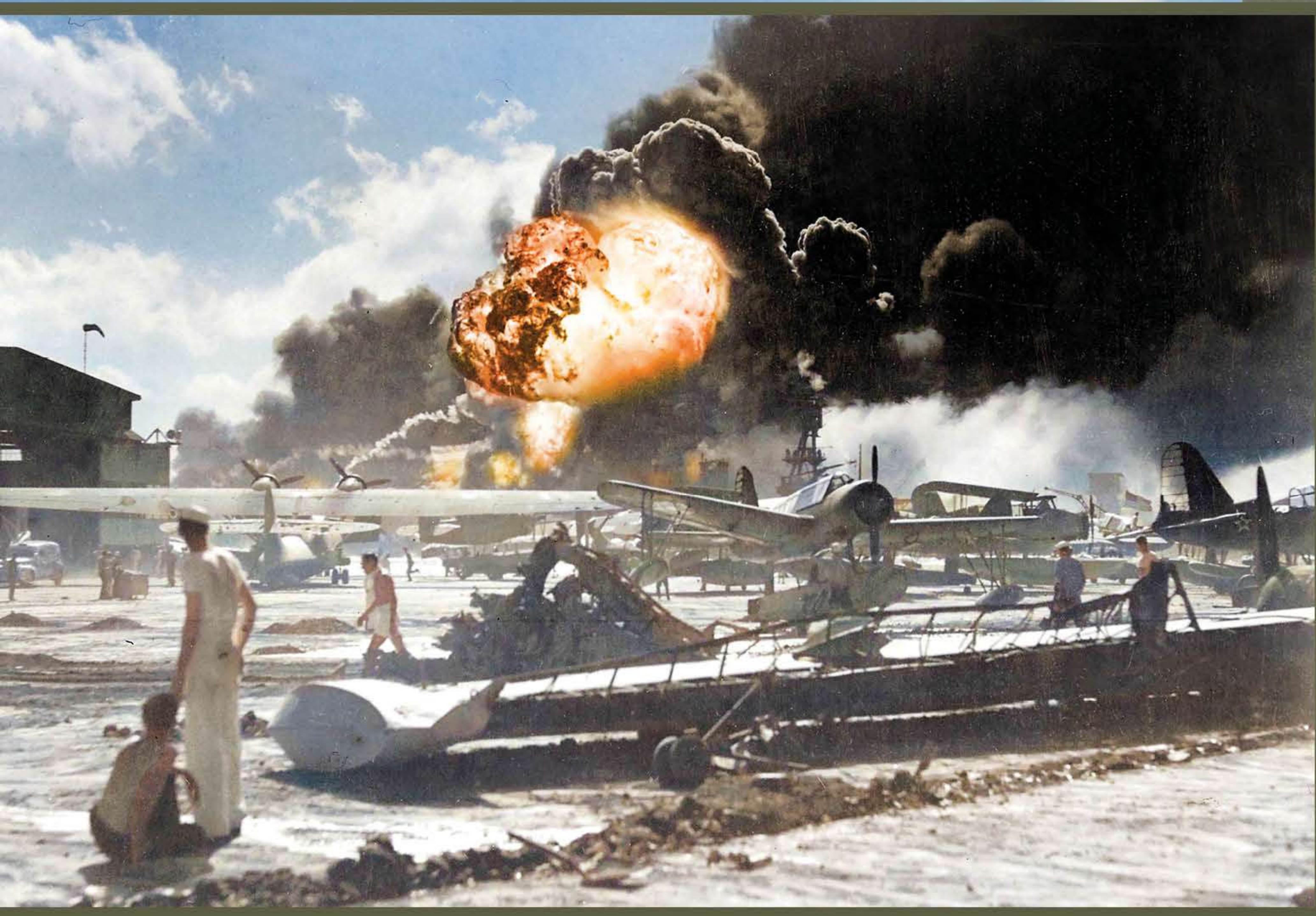
📍 Zniszczenia w Pearl Harbor po japońskim nalocie 7 grudnia 1941 r.

In December 1941, the United States entered the war, which changed the balance of power on the front. Now the war extended to nearly every corner of the world.