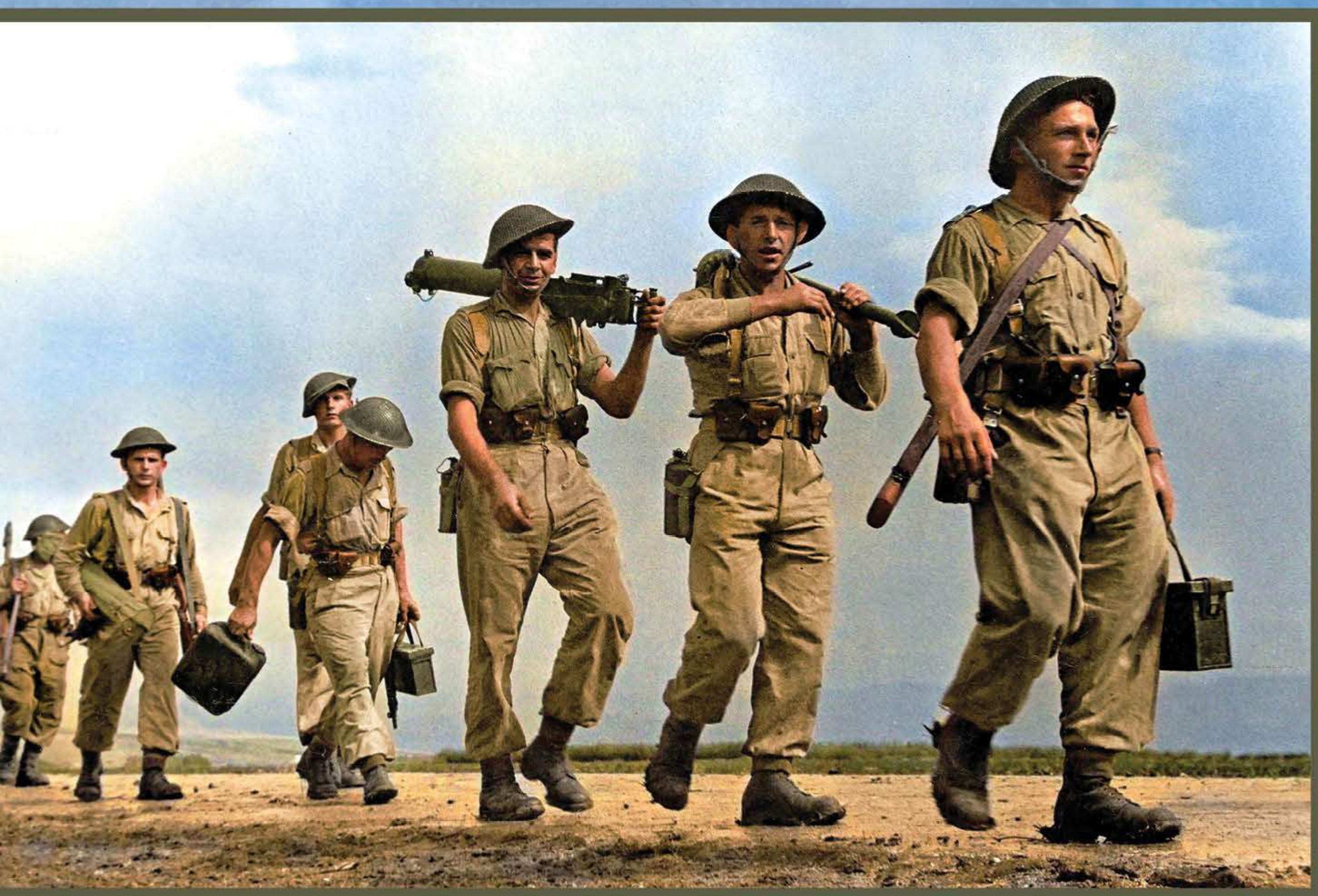
Żołnierze Armii Polskiej na Wschodzie w drodze na ćwiczenia

Soldiers of the Polish Army in the East on their way to military exercises