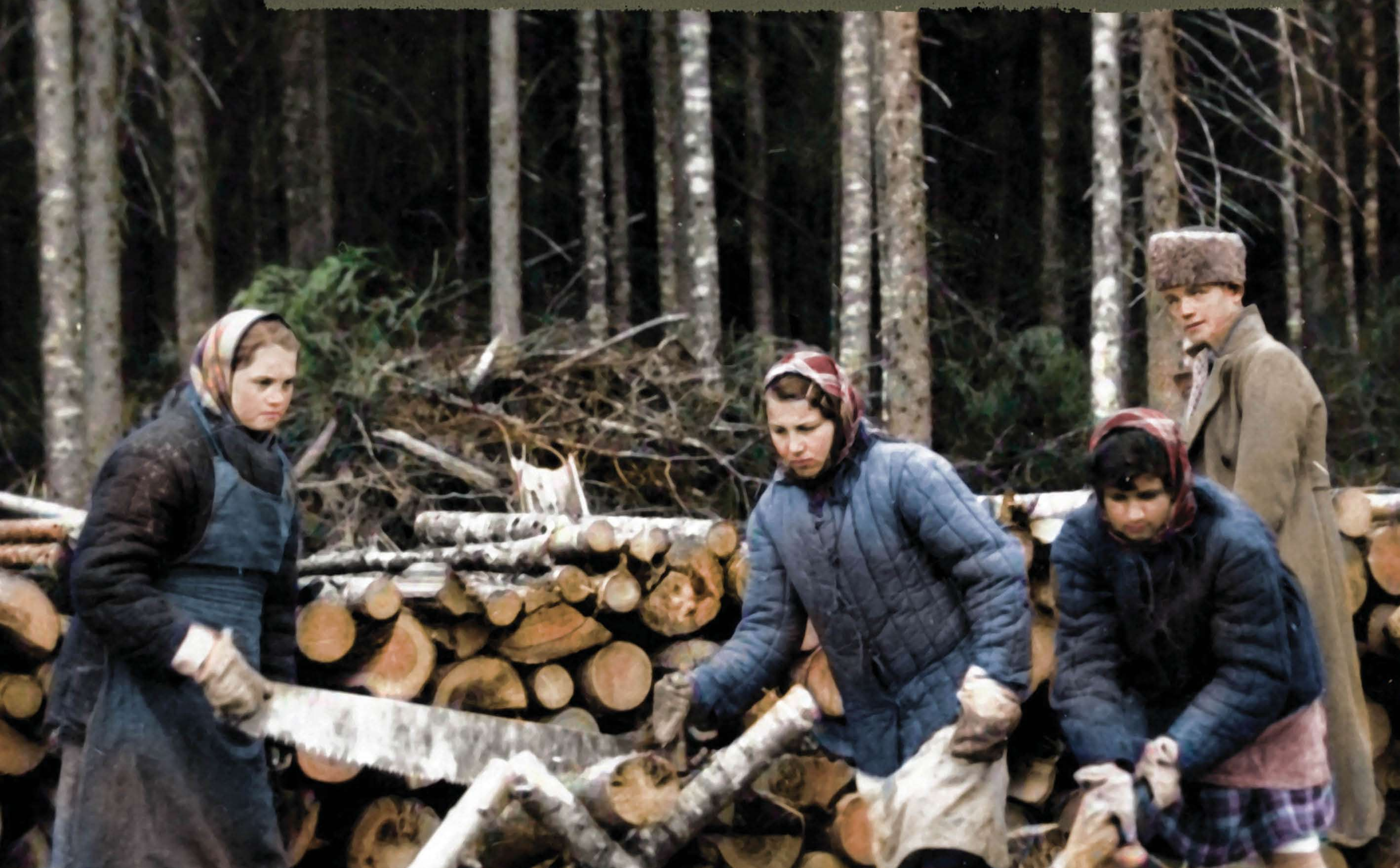
Grupa kobiet pracujących przy wyrobie lasu w okolicach Swierdłowska w ZSRS, 22 listopada 1940 r.

Polish soldiers and police officers imprisoned by the Soviets in 1939 were transported to special NKVD camps in Kozelsk, Starobelsk, and Ostashkov, and subsequently executed as part of the Katyn Massacre which was decreed by the highest Soviet authorities on 5 March 1940.