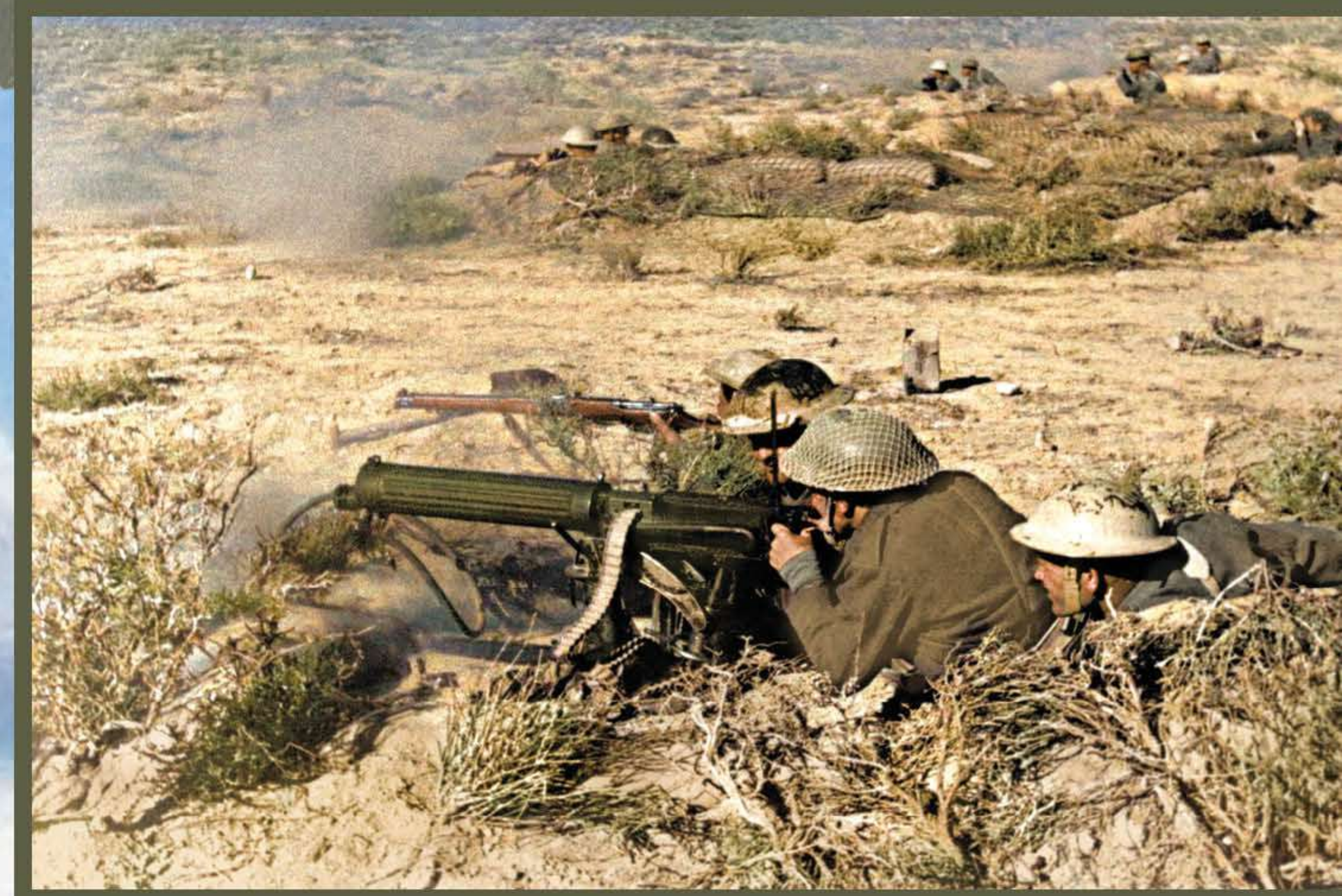
📍 Żołnierze Samodzielnej Brygady Strzelców Karpackich na pierwszej linii frontu na pustyni pod Tobrukiem. Libia, grudzień 1941 r.

The destruction at Pearl Harbor after the Japanese air raid of 7 December 1941