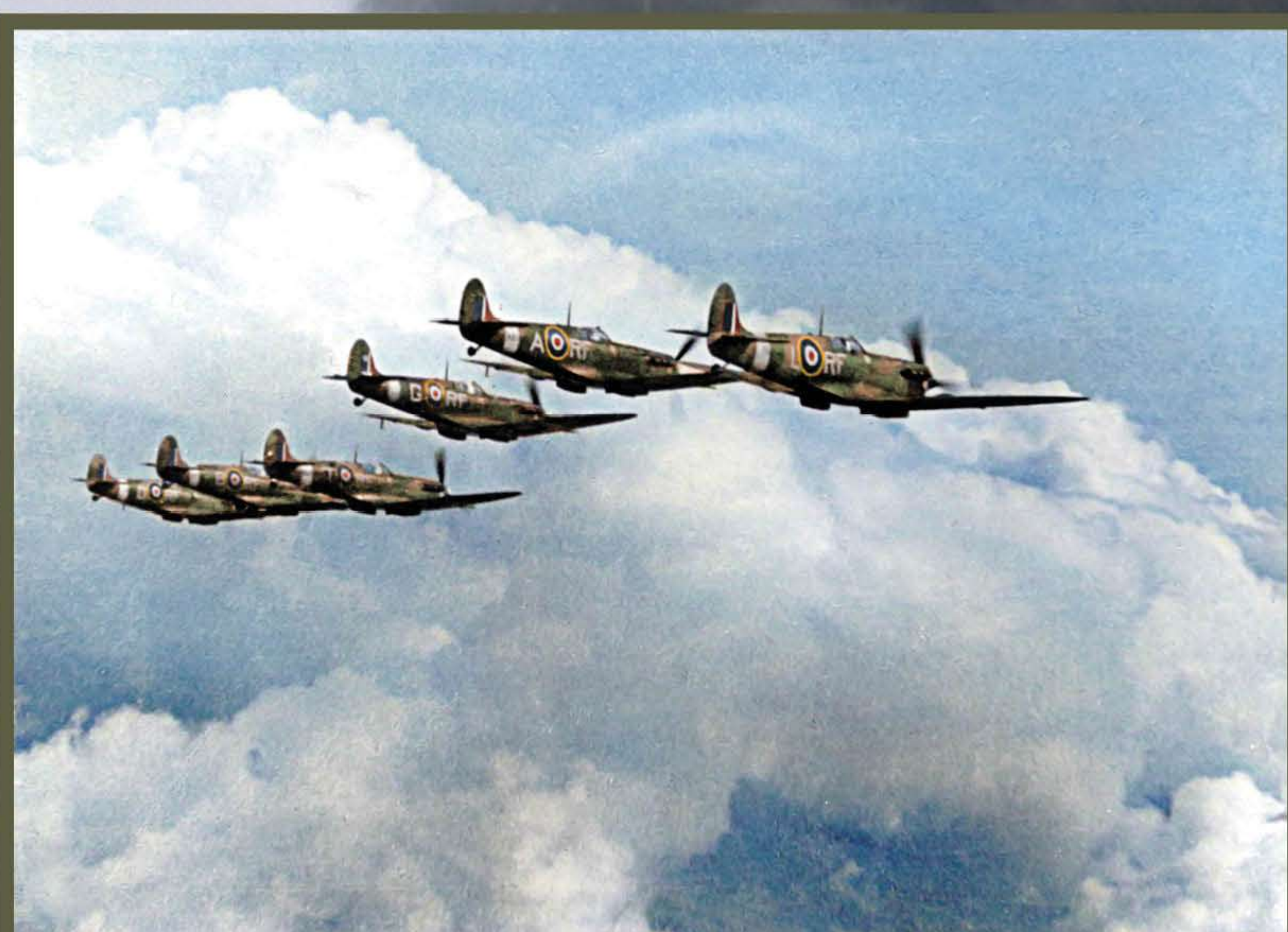
✈ Samoloty Dywizjonu Myśliwskiego 303, Wielka Brytania, 1942 r.

The Polish I Corps was formed by order of the Commander-in-Chief of the Polish Armed Forces, General Władysław Sikorski. Polish squadrons fought in the Battle of Britain, with Poles joining the fray when the largest aerial battle in the world was entering its decisive phase. Allied victory was possible thanks to the cooperation of pilots from many countries occupied by the Germans. It was thanks to their devotion that the invasion of the United Kingdom could be prevented.